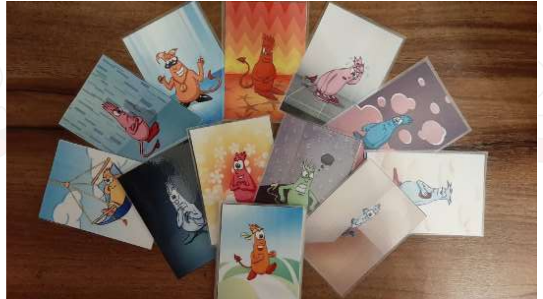
МАК «Монстрики чувств»