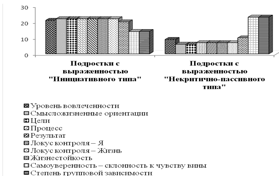
Рис. 3. Особенности компонентов личного потенциала у подростков с выраженностью «Инициативного типа» и «Некритично-пассивного типа»

В группе подростков с выраженностью «Некритично-пассивного типа» преобладают низкие значения по шкалам: «Уровень вовлеченности» ( p \leq 0,001 ), «Смысложизненные ориентации» ( p \leq 0,001 ), «Цели» ( p \leq 0,001 ), «Процесс» ( p \leq 0,001 ), «Результат» ( p \leq 0,001 ), «Локус контроля – Я» ( p \leq 0,001 ), «Локус контроля – Жизнь» ( p \leq 0,001 ), «Жизнестойкость» ( p \leq 0,01 ), и высокие значения по шкалам: «Самоуверенность – склонность к чувству вины» ( p \leq 0,01 ), «Степень групповой зависимости» ( p \leq 0,01 ).