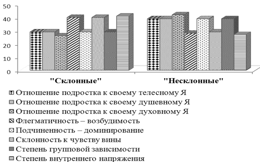
Рис. 2. Особенности личного потенциала подростков, «склонных» и «несклонных» к виктимному поведению